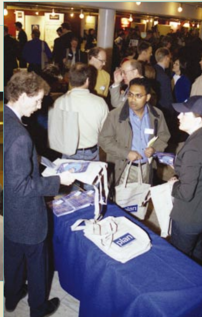
Bilderna är från 2002 års PLAN-konferens.